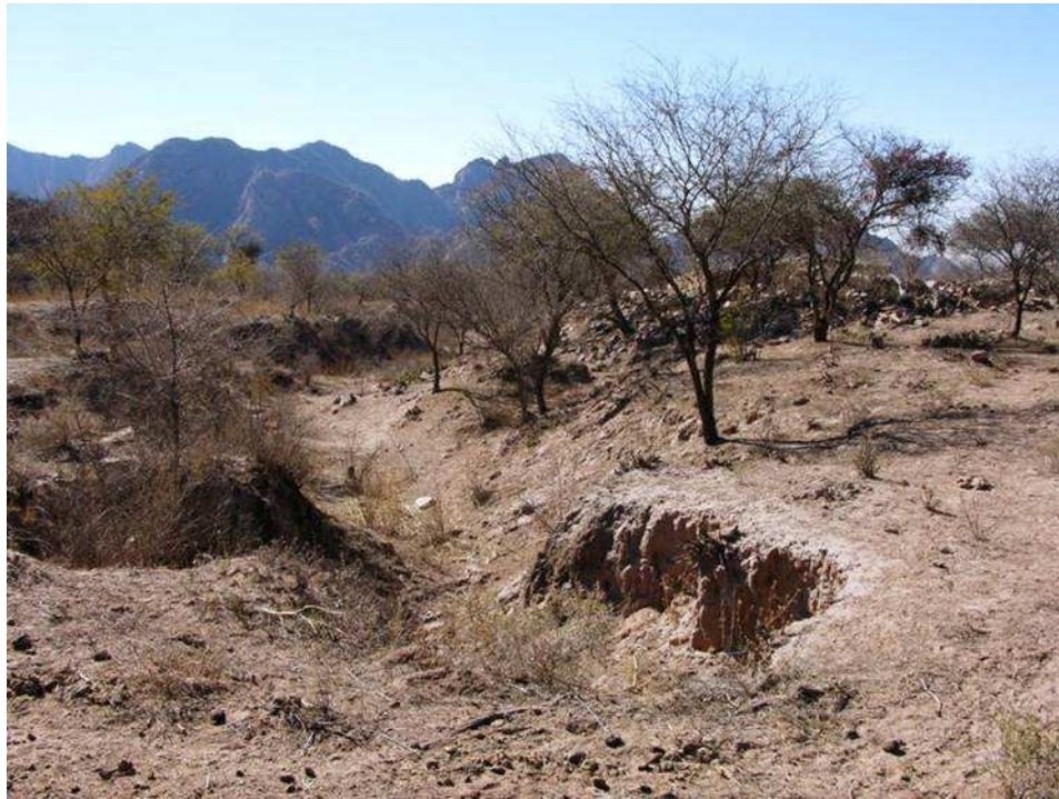
Imagen 5: Fotografía de una de las cárcavas que escurre en sentido oeste-este, al sur de la kallanka 2. Su cabecera presenta un ancho de 2,60 metros, en esta área han desaparecido casi por completo las estructuras, las cuales se presentan prácticamente irreconocibles.

todos los jugadores claves estén involucrados en el mismo. Es por ello que los trabajos de concientización se encararon primariamente en los funcionarios públicos, a fines de garantizar la implementación de las acciones de conservación y su sostenimiento a largo plazo.