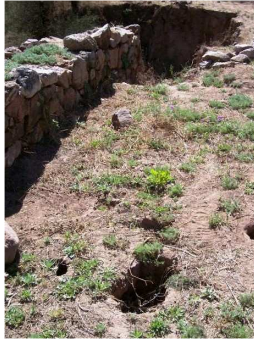
Imagen 3: Afección provocada por las madrigueras de ututucos ( Ctenomys sp. ).

Siguiendo con las tareas desarrolladas, se plantearon obras para rellenar las excavaciones, se colocará una capa de unos 5 cm de arena y posteriormente se rellenará el resto con tierra de excavación que se encuentra en los alrededores de las estructuras.