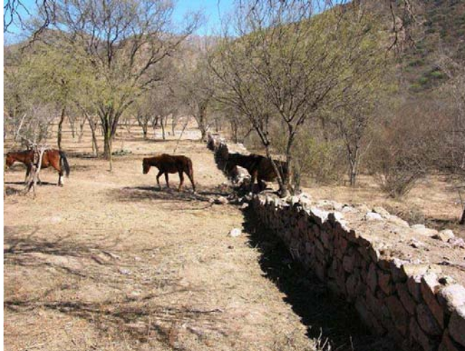
Imagen 4: Animales sueltos atravesando el muro norte de la aukaipata o plaza.

problemas de deterioro detectados en el sitio, como por ejemplo los producidos por las actividades turísticas desorganizadas y descontroladas.