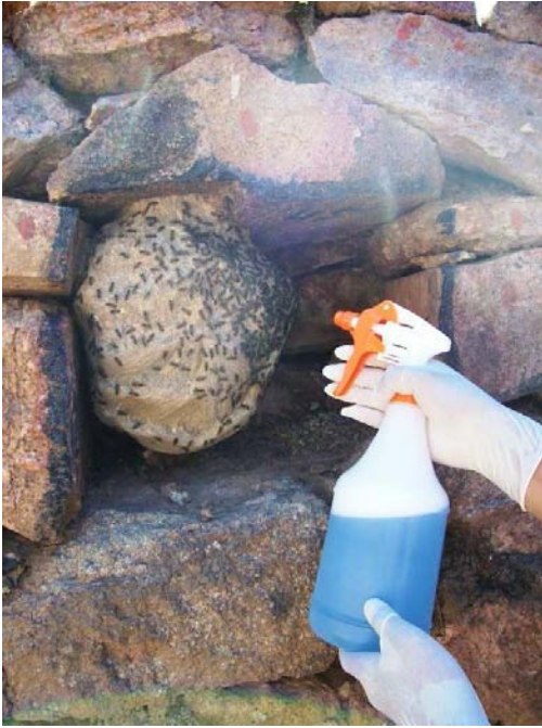
Imagen 2: Control de un nido de avispas ( Brachygastra lecheguana ) en una hornacina de la kallanka 1.

En este sentido podría combinarse la conservación del patrimonio cultural con el natural y recuperar por ejemplo la lechuza, que debido a la presencia humana fue retirándose del lugar y que ayudaría a controlar la población de ututucos.