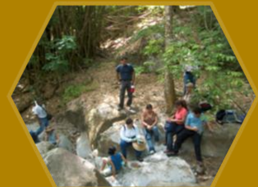
Estudiantes en yacimiento Caguaitas