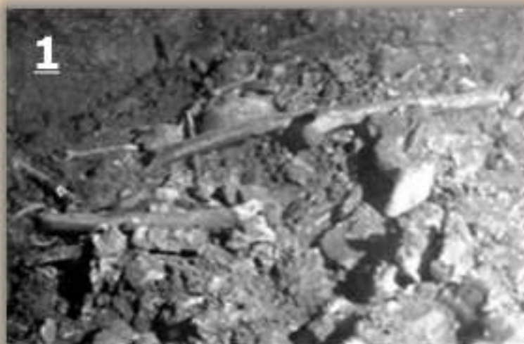
Foto 1. Descubrimiento del cimarrón el 2 de junio de 1969