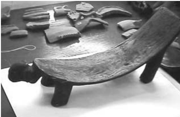
Figura 4: Piezas

Aun cuando se está lejos de excavar la totalidad del sitio, las intervenciones han localizado artefactos de madera en contextos arqueológicos no alterados, en número superior al medio millar, entre utilitarios, constructivos o ceremoniales, lo que la convierte en la colección más importante de Cuba y Las Antillas. (Ver Fig.4)