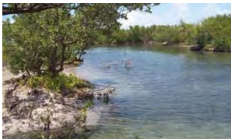
Figura 3: Buchillones

El área arqueológica se extiende 1 500 m de Este a Oeste, y se amplía unos 50 m hacia el norte, dentro del mar, frente a toda la línea de costa norte, incluyendo una pequeña laguna costera. (figura 3)