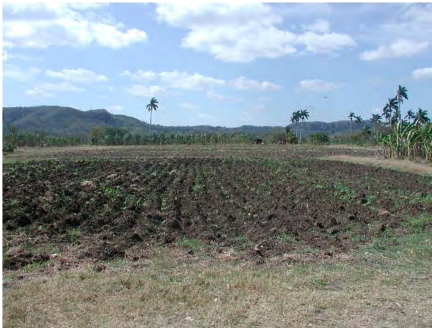
Figura 3. El sitio arqueológico. Entre sus tierras se hallan gran cantidad de evidencias que afloran producto del arado.

Por su parte Ontañón (1996) señala que el desarrollo tecnológico es una plasmación de las relaciones sociales y económicas, dentro de la concepción materialista de que los objetos arqueológicos tienen implícita una relación más o menos directa con la sociedad que los confeccionó, de donde se deduce que esta puede ser estudiada a través del análisis de aquellos, cuyos cambios reflejan asimismo transformaciones más profundas de orden socioeconómico. Con respecto a esto Engels (1961) plantea que la habilidad en la producción de los medios de existencia es lo más a propósito para establecer el grado de superioridad y de dominio de la naturaleza conseguido por la humanidad.