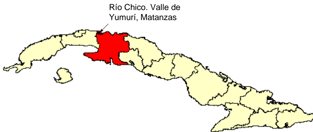
Figura 1. Ubicación de Río Chico en el Valle de Yumurí, Matanzas, Cuba.

A propósito de la polémica existente en cuanto a las comunidades en cuestión, se trazaron objetivos para tratar la complejidad de las actividades agrícolas de las mismas en un asentamiento enclavado en las inmediaciones del valle de Yumurí, aportando algunos datos de interés entorno a estos grupos.